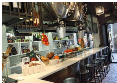
Tapas Bar Casa Guinart

Die Tapas Bar Casa Guinart ist dabei ein echter Geheimtipp und bekannt für ihre schmackhaften Tapas zu deren Herstellung Produkte des nahen Wochenmarktes verwendet werden. Das Programm des ersten Abends endet schließlich um 24 Uhr mit dem Rückweg zum Hotel.