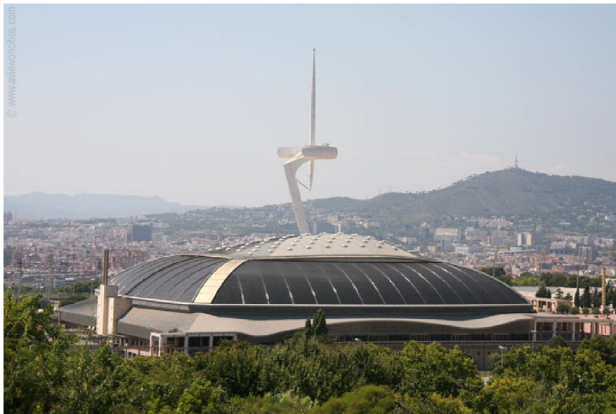
Palau San Jordi, Barcelona